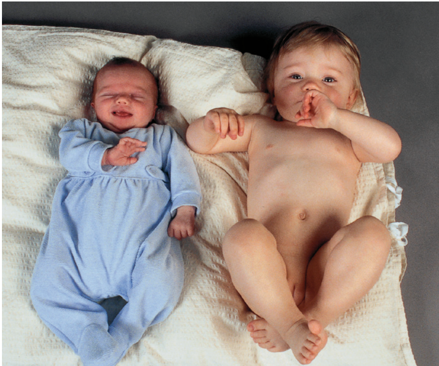
Væksthastigheden er meget høj det første leveår.

man skal intervenere, og hvornår der skal henvises fra sundhedsplejerske til egen læge eller fra egen læge til børneafdeling er beskrevet i detaljer i Monitorering af vækst hos 0-5-årige børn. Vejledning til sundhedsplejersker og praktiserende læger (Sundhedsstyrelsen 2015). Det er vigtigt, at målingerne plottes ind på en vækstkurve, og at det er den samlede vækst, der vurderes.