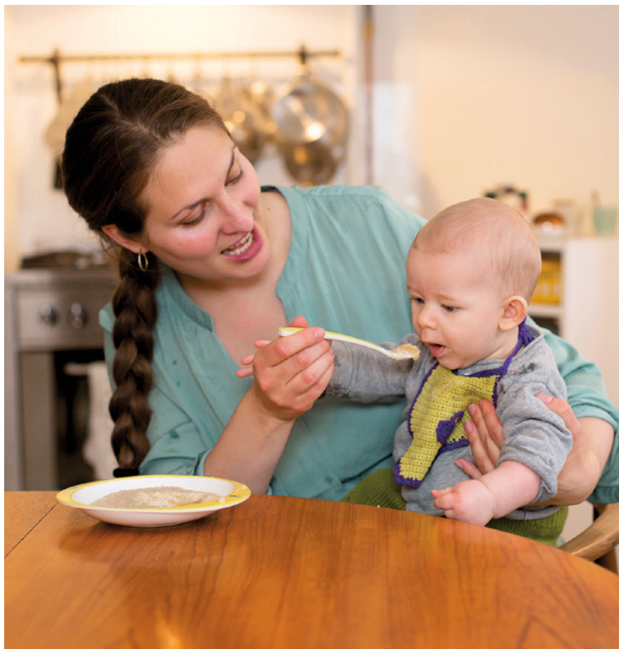
Hjemmelavet grød med lidt frugtmos er god at starte dagen på.

barn og fra måltid til måltid. Det kræver, at forældrene er opmærksomme, tålmodige og i stand til at aflæse spædbarnets signaler på om det fx er sultent, mæt, træt eller har brug for en pause som beskrevet i afsnit 2.1.1.