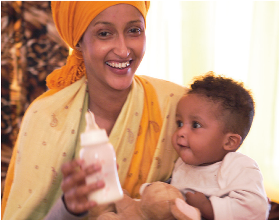
Overgangskosten suppleres her med modermælksersatning.

Det er en gængs opfattelse, at risstivelse i en mængde på 15 % af kulhydratet kan give større mæthedfølelse. Der foreligger ikke videnskabelig dokumentation for dette.